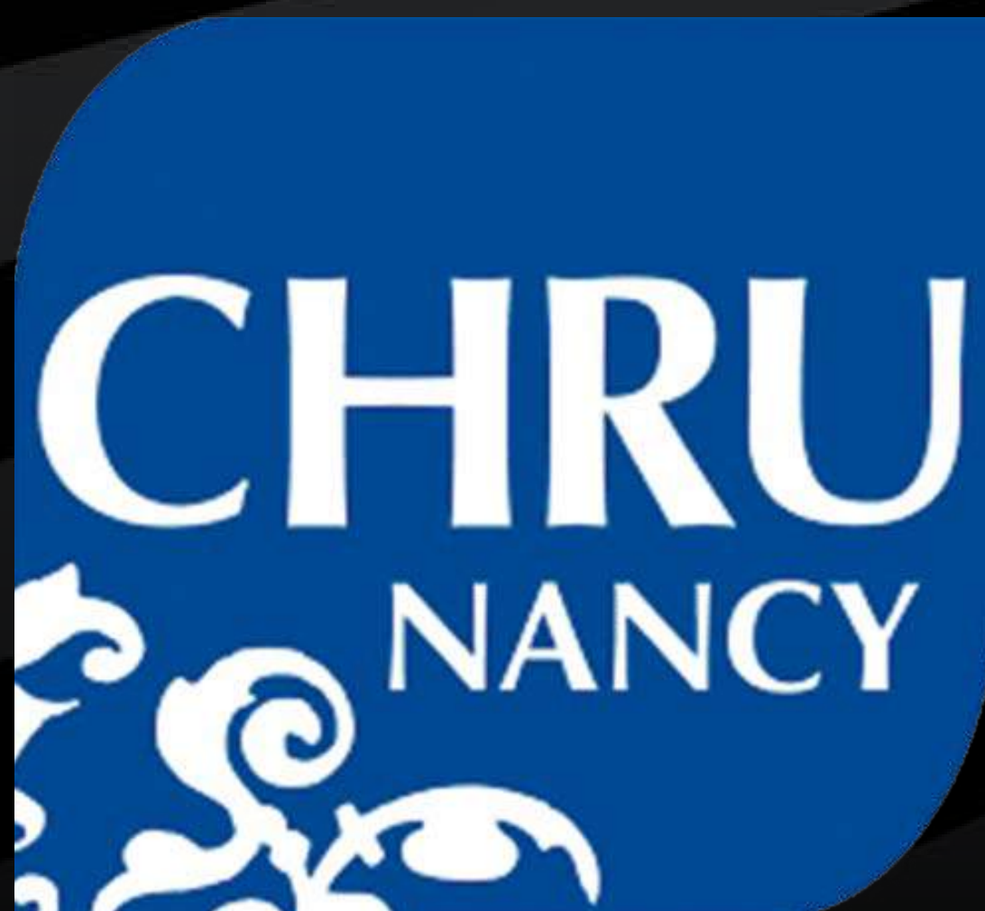
CHRU NANCY LORS D'UN SÉMINAIRE À VITTEL