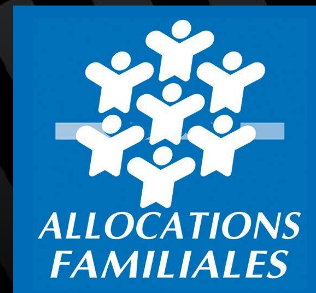
LA CAF DE NANCY LORS DE LA JOURNÉE DES FAMILLES