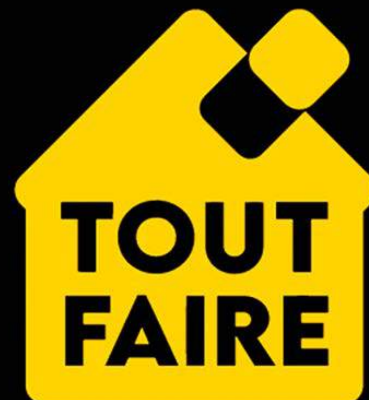
TOUT FAIRE LORS D'UN SÉMINAIRE À BRABOIS