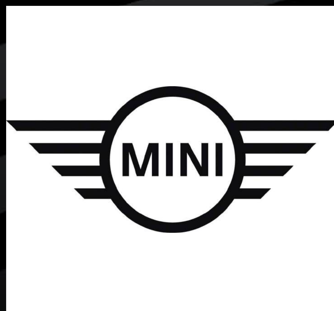
MINI NANCY ET METZ LORS D'UNE SOIRÉE PRIVÉE