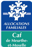
La CAF de Nancy Lors de la journée des familles